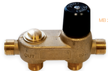
MB 20, MB 25

Dient zur einfachen Einbindung Ihrer excaltron® Wasserenthärtung in die Wasserzuleitung. Gleichzeitig wird hier die gewünschte Wasserhärte eingestellt. Robuste Technik, sehr einfach zu bedienen.